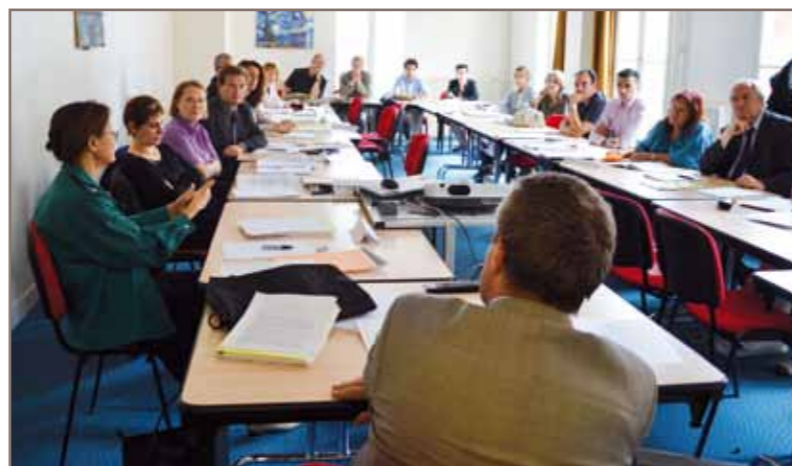
Session "Magistrats chefs de service au sein d'une juridiction niveau II", en mai dernier

* Circulaire de la Direction des services judiciaires du 18 février 2011