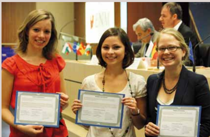
L'équipe française Promotion 2011, vainqueur en demi-finale A

Directeur de la Publication : Jean-François THONY Directeur de la rédaction : Eric BRAMAT Réalisation : Service de la Communication Imprimerie : CARACTERE SAS - AURILLAC N°CPPAP : 3073 ADEP - N°ISSN : 1261 0658