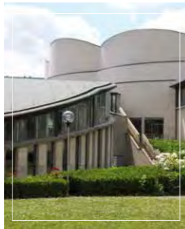
Université d'Artois - Douai