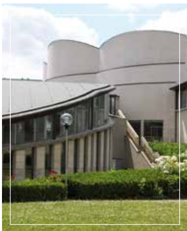
Université d'Artois - Douai