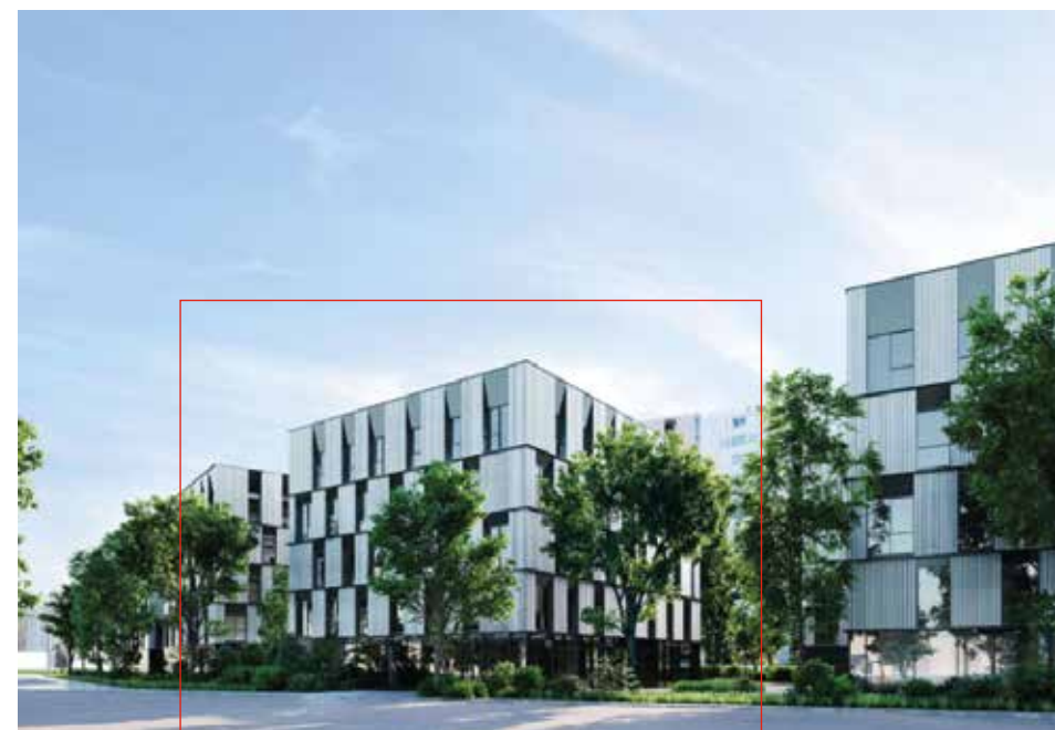
Vue 3D du futur bâtiment Archipel, second site bordelais de l'ENM.

au sein de la promotion 2024, auxquels s'ajoutent 26 élèves avocats et des auditeurs du département international