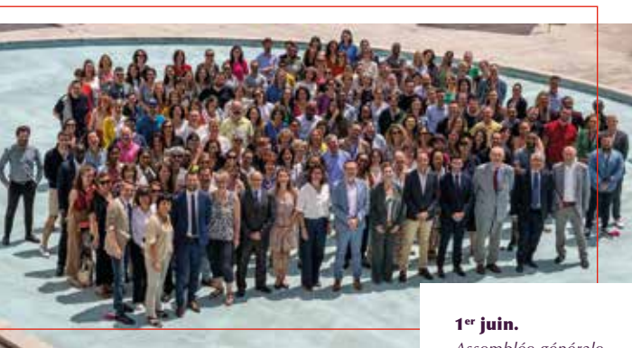
1 er juin. Assemblée générale des personnels.

Dans la capitale parisienne, l'ENM investira également de nouveaux locaux de 750 mètres carrés dès avril 2024. Stratégiquement localisés aux portes de Paris, sur la ligne 1 du métro (station Saint-Mandé), ils permettront de regrouper une dizaine de salles de formation actuellement dispersées sur cinq sites.