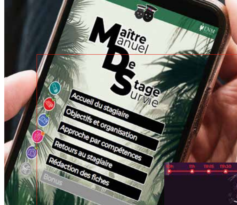
Application « Manuel de survie » à destination des maîtres de stage et serious game utilisé au cours du séminaire international « La Place des victimes dans les procédures pénales dites hors norme » par le service de l'appui à la pédagogie.

Sciences de l'éducation et ingénierie pédagogique constituent des disciplines à part entière et des savoirs qui ont tout naturellement leur place au sein d'une grande école de la République. Ainsi, l'ENM a recruté plusieurs conseillers pédagogiques qui proposent de nouveaux formats d'enseignement, appuient les équipes de formateurs dans l'élaboration des séquences et contribuent à l'analyse des besoins, la conception et la mise en œuvre des actions de formation et permettent l'appropriation de nouvelles méthodes.