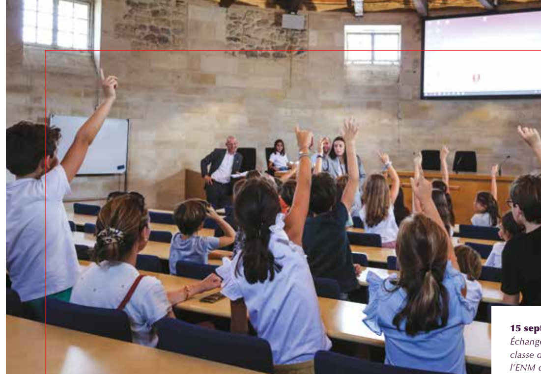
15 septembre. Échange avec une classe de CM2 venue à l'ENM dans le cadre des Enfants du patrimoine.