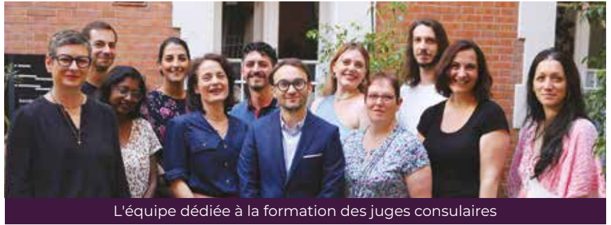
L'équipe dédiée à la formation des juges consulaires

Tous les juges consulaires qui ont commencé leur premier mandat après le 1 er novembre 2018 doivent suivre une formation initiale obligatoire de 8 jours. Les juges consulaires qui ne sont pas soumis à cette obligation de formation initiale, et ceux qui ont intégralement achevé leur parcours de formation initiale, doivent suivre 2 jours de formation continue par année civile . Ils choisissent librement leurs formations parmi celles proposées dans ce catalogue, classées selon les compétences qu'elles visent à renforcer.