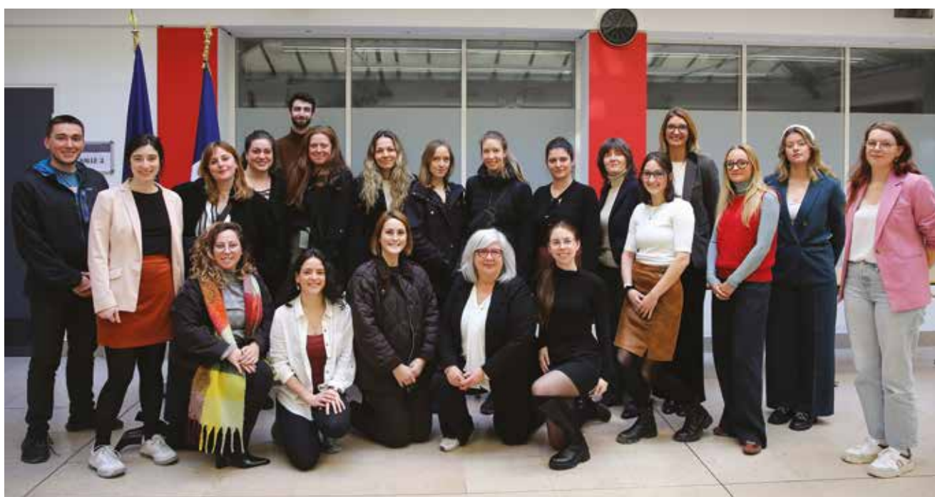
Visita de una delegación de jueces y fiscales de Quebec, 6 de marzo de 2025