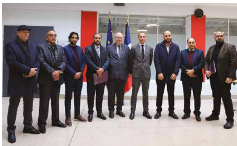
Visita de una delegación de jueces y fiscales libios, 17 de febrero de 2025