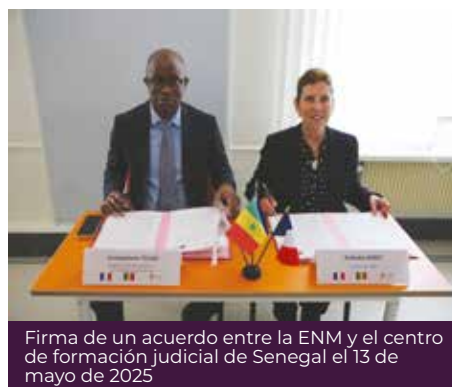
Firma de un acuerdo entre la ENM y el centro de formación judicial de Senegal el 13 de mayo de 2025