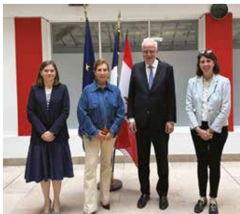
Visita del Primer Ministro libanés, 27 de mayo de 2025