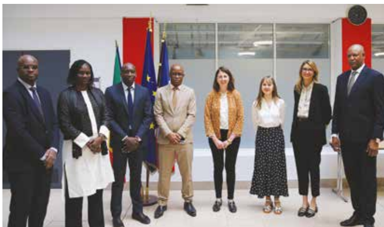
Visita de una delegación de jueces y fiscales senegaleses, 12 de mayo de 2025