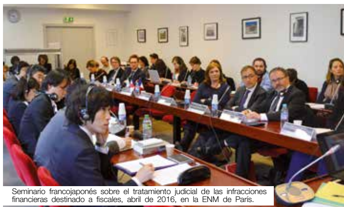
Seminario francojaponés sobre el tratamiento judicial de las infracciones financieras destinado a fiscales, abril de 2016, en la ENM de París.